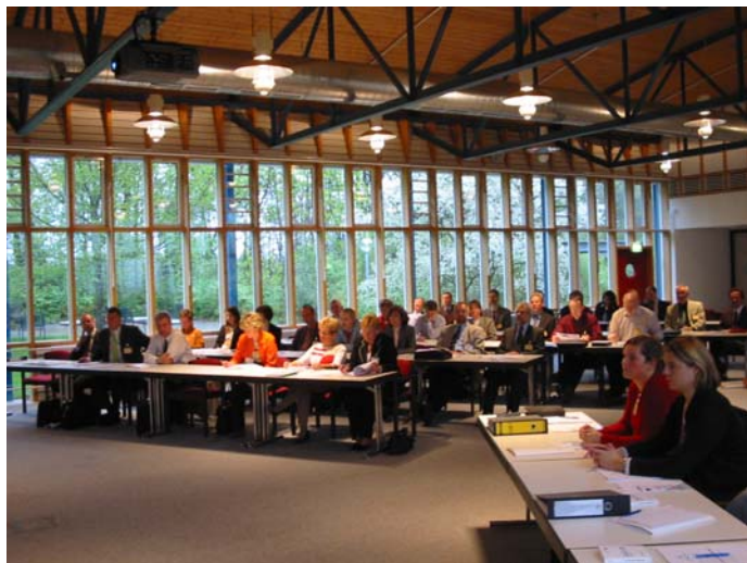
Abbildung 1: Durch Referate und Workshops wurden erste Projektziele erreicht.