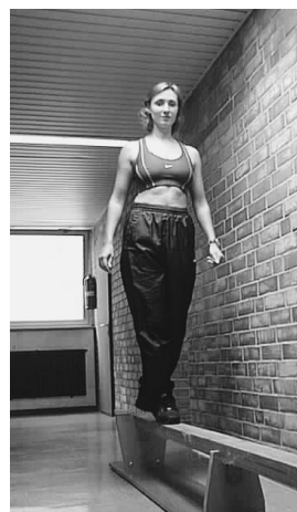
Abb. 1 Testausschnitte einer EFL-Untersuchung. (a) Kriechen, (b) Schieben, (c) Vorgebeigtes Sitzen, (d) Knien, (e) Balancieren

aufgenommen. Ein Expertenteam wählte 50 Bilder aus, die für den Test in einem Katalog zusammengestellt wurden; Abb. 2 zeigt ein Beispiel. Die Reliabilität des PACT wurde in Studien überprüft.