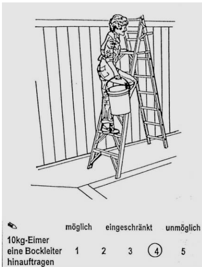
Abb. 2 Frage 38 aus dem PACT.

Diese Hauptbeurteilungspunkte sind wieder unterteilt, beispielsweise für den Arbeitsplatz: