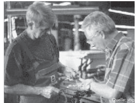
Arbeitsmedizinische Beratung vor Ort