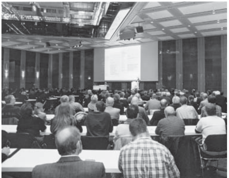
Gut besuchte A+A - Veranstaltungen spiegeln das große Interesse wider.